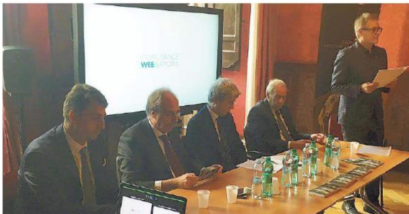
Un momento della presentazione che si è tenuta ieri a Roma

Attraverso un comitato artistico di esperti italiani ed internazionali, Nid Platform seleziona le migliori compagnie e gli spettacoli più rappresentativi della scena italiana sia tra le realtà già consolidate sia tra i coreografi emergenti. Questi sono inseriti all'interno di un ricco programma che si estende per alcuni giorni e prevede anche momenti di confronto, attività collaterali e tavoli tematici. «Sarà un momento importante per la nostra città - il commento entusiastico del sindaco Romoli -. Si tratta di un palcoscenico nazionale